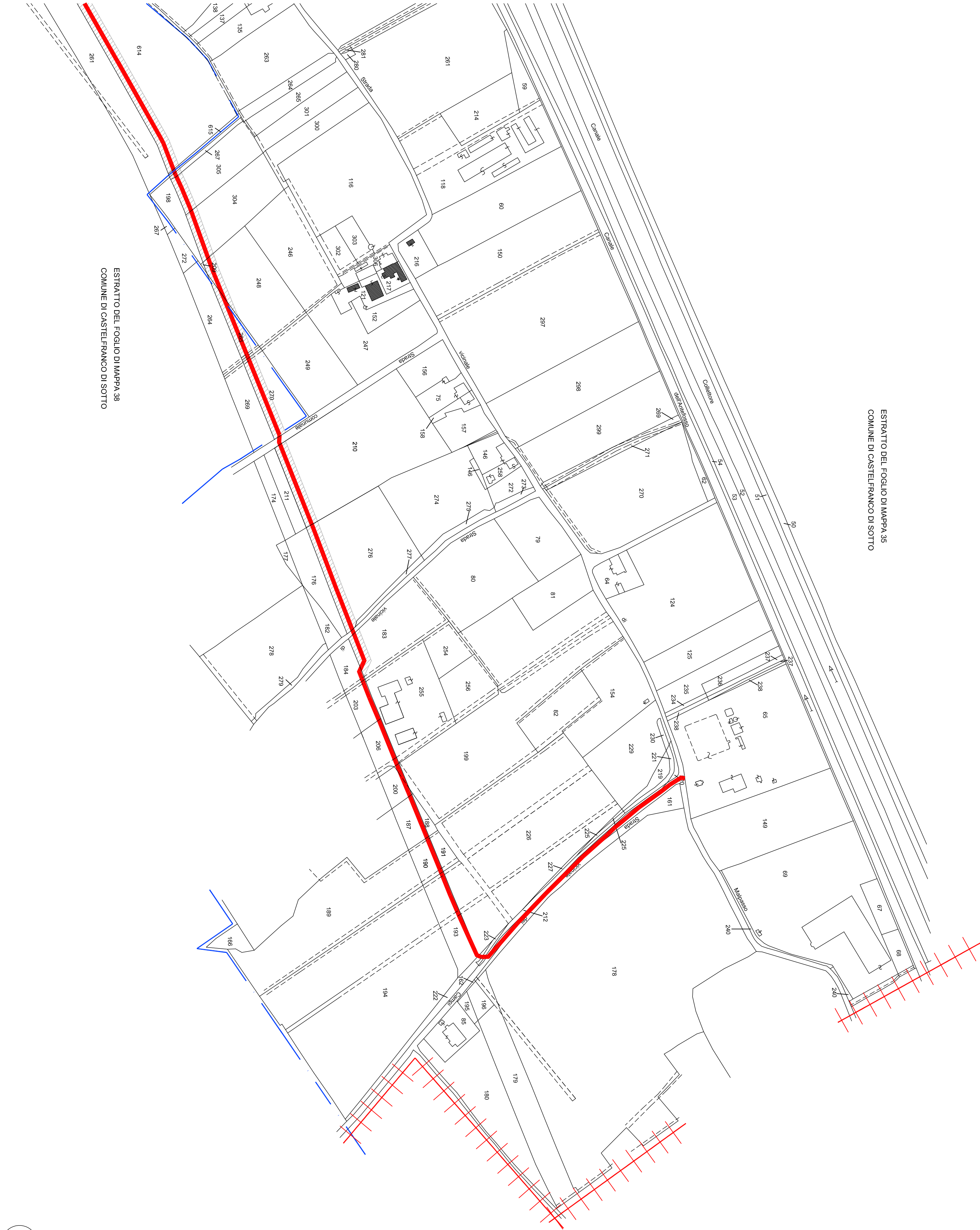
ESTRATTO DEL FOGLIO DI MAPPA 38 COMUNE DI CASTELFRANCO DI SOTTO